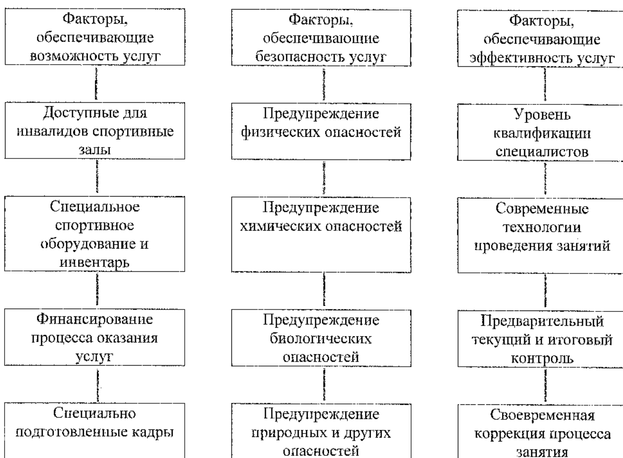
Рисунок 1. Факторы, влияющие на доступность услуг для инвалидов и других маломобильных групп населения на объектах спорта и в учреждениях и организациях, предоставляющих услуги

Понятно, что для обеспечения возможности предоставления и получения услуг для инвалидов и МГН необходимо наличие кадров, имеющих право работать с данным контингентом.